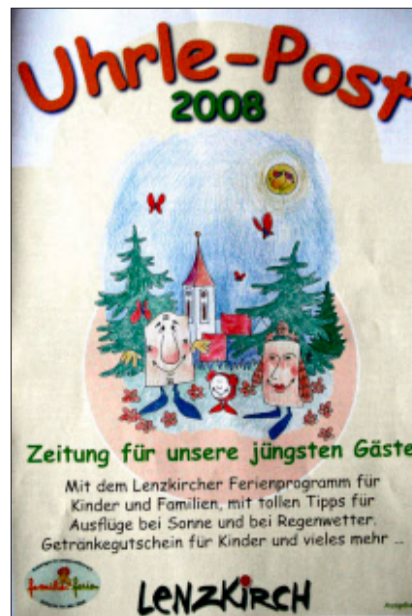
Die neue Lenzkircher „Uhrle-Post“ liegt vor. Darin enthalten ist das komplette Kinderferienprogramm für 2008.

Im vergangenen Jahr nahmen über 900 Kinder die Angebote der Familienferien wahr. Damit wurde der Rekord von 2005